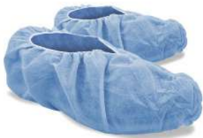
Cubre Calzado desechable