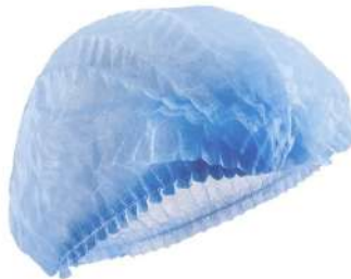
Cofia / Gorro desechable