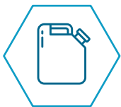
Amonio Cuaternario (5 litros)