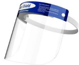
Escudo facial protector