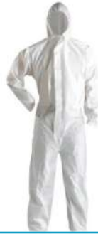
Buzo desechable Blanco / Alternativo