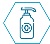
Alcohol Gel (1 litro – 5 litros)